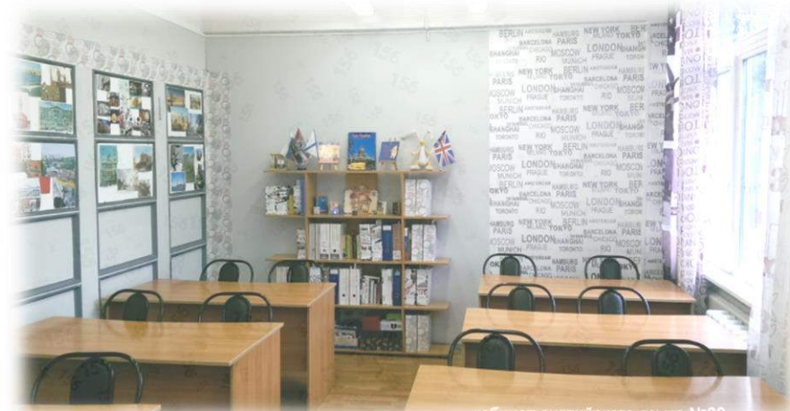
кабинет английского языка №39