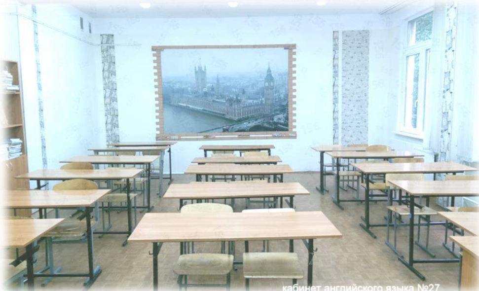
кабинет английского языка №27