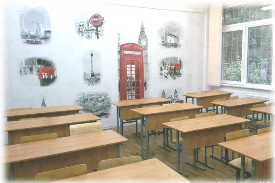
кабинет английского языка №7